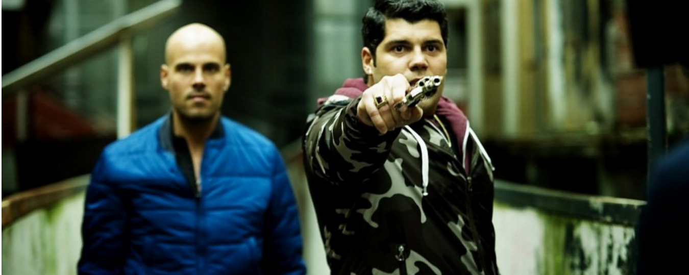
Gomorra the series.

“Sono molto felice di questa collaborazione con ITTV Festival”, il commento di Sannelli , “perché quest’anno il Kinéo ha cambiato veste e si chiamerà ‘Kinéo New Generation’ proprio per la sua capacità di rinnovarsi restando sempre al passo con i tempi. È importante creare una forte sinergia tra il mondo cinematografico e quello televisivo, soprattutto con l’avvento delle piattaforme streaming nazionali ed internazionali che hanno reso universale questo settore, rendendolo ancora più ricco, seppur il grande schermo resta sempre molto affascinante”.