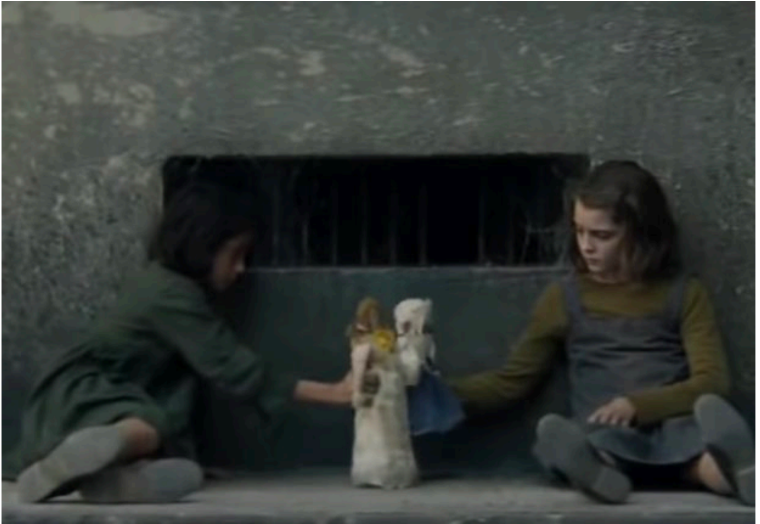
A scene from "My Brilliant Friend"